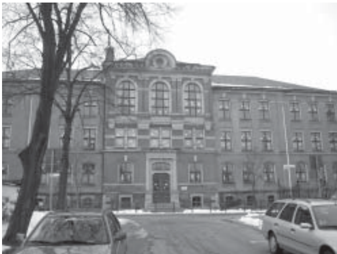
Mittelschule „Schule des Friedens“ Ehrenfriedersdorf