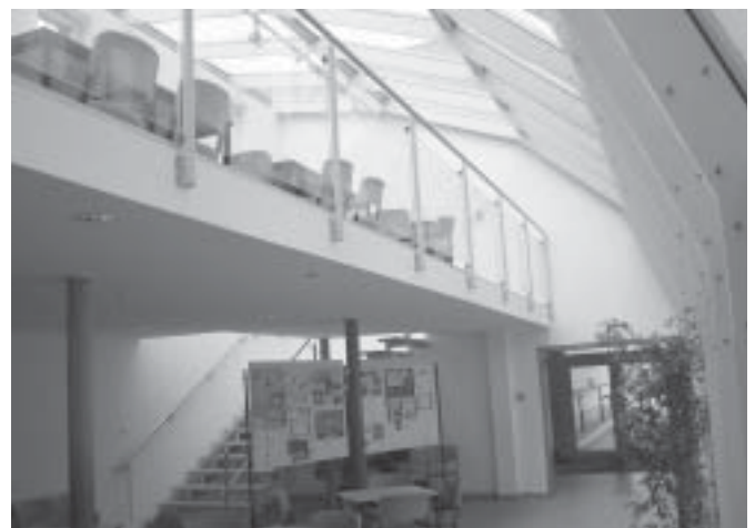
unsere gemütliche Cafeteria